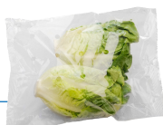
Lámina Flow Pack