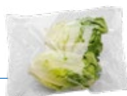
Lámina Flow Pack