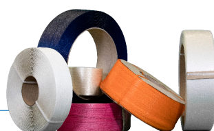
Feuillards de cerlage