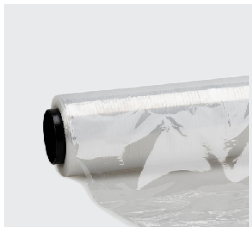
Film avec mandrin en plastique

Pour toute autre mesure, veuillez contacter votre représentant commercial