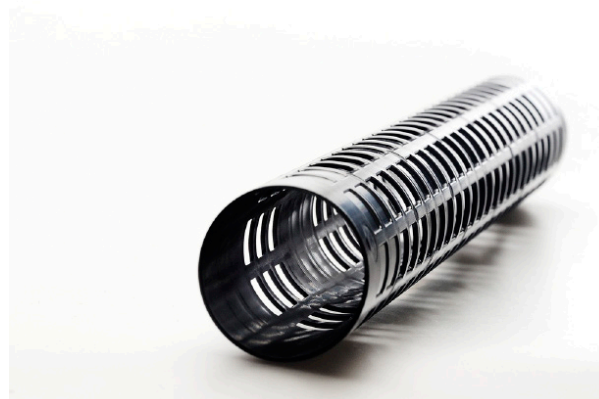
Film disponible avec un mandrin en plastique, un mandrin en carton ou sans mandrin.

Il est toutefois nécessaire de distinguer film étirable et pré-étiré.