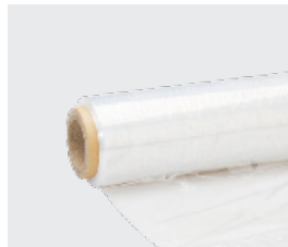
Film avec mandrin en carton