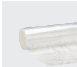
Film sans mandrin (coreless)